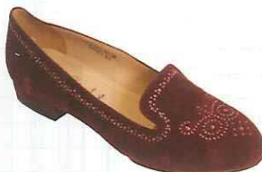
缀闪钻包头平底鞋 RM399.90/Zang Toi

裙装是OL重复搭配的决胜单品，简约的设计感就是此单品中必备的元素。虽是纯净的纯色包臀裙，但不规则的小折纹却营造出不一样的剪裁轮廓，不经意呈现出裙装美感。