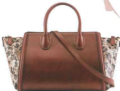
动物纹X皮革两用包 价格店洽/MCM

可手拎抑或是单肩携带的两用包是通勤包款中的热门款式，酒红色与动物纹的搭配让此包款洋溢出别雅的时髦品味，颇为出众。