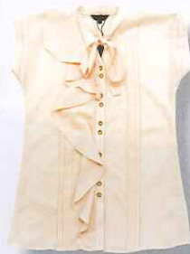
波浪褶皱短袖衬衫/BIEM

做事需分轻重，在穿搭法则上其实也必须“轻重有致”呢~在此要点出的搭配方式是一种万年不变的混搭法——上轻+下重，这一类mix & match难度不高，又极容易显出淑女风范。