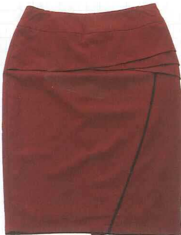
不规则折纹设计感包臀裙 RM109/BIEM

可手拎抑或是单肩携带的两用包是通勤包款中的热门款式，酒红色与动物纹的搭配让此包款洋溢出别雅的时髦品味，颇为出众。