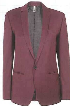
长袖西装外套 价格店洽/Topshop

短版女靴的甘辛时尚格调有别于其他类型的鞋履，滑面面料与粗跟设计搭配起来不会显得沉重，反而更显率性品味。