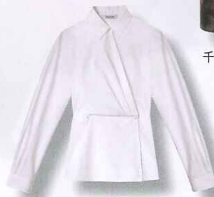
白色简约款长袖衫/Max Mara