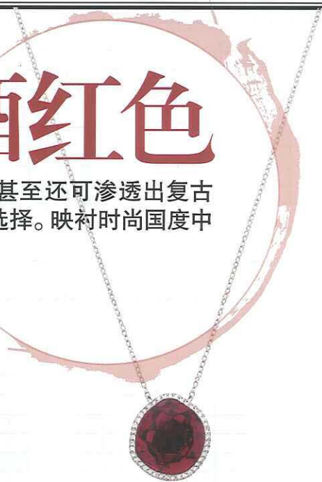
华贵感水晶吊坠项链 价格店洽/Swarovski

在稳健格调中，细致闪钻拼贴出微妙的亮点，而绒面元素则让此一鞋履的复古风尚更为突出，整体性协调得十分得当。