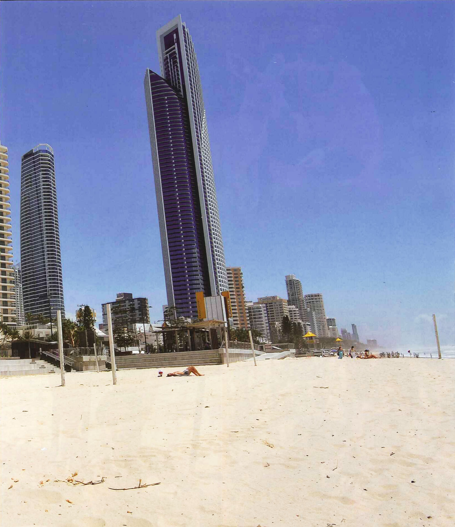
oleh : NURUL HUSNA MAT RUS penyelaras : AZLIE HALIM pembantu : CATHERINE HO pakaian : JEEP & KOLEKSI PERIBADI ZIZAN lokasi : BRISBANE & GOLD COAST, AUSTRALIA terima Kasih : EUROVAC GROUP, EURO EXPLORE & TOUR SDN BHD.