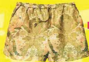
H&M 暗花短裤, RM129