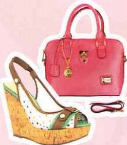
CHARLES & KEITH 松糕鞋, RM159.90 www.zalora.com.my, 粉红手袋, RM189.90