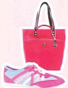
LARRIE 双色球鞋, RM109.90 CARLO RINO 两用手提包, RM169