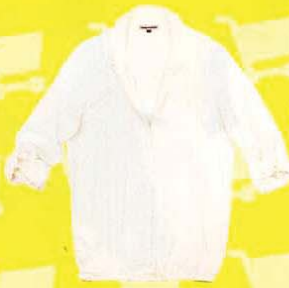
BERSHKA 宽松上衣， RM119