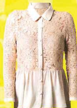
www.azorias.com 蕾丝恤衫, RM139

cape: FBLOCK , RM59; necklace: H&M , RM79.90; pants: FBLOCK , RM59.90; bangle: FBLOCK , RM19; belt: FBLOCK , RM13; shoes: FBLOCK , RM93