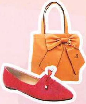
CARLO RINO 桃红尖头鞋, RM69 CARLO RINO 皮革手袋, RM229