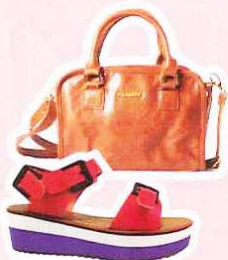
PULL & BEAR 皮革手袋, RM129.90 AMORI 厚底凉鞋, RM79.90