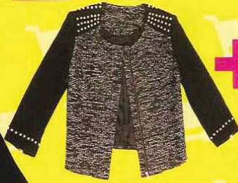
BERSHKA 拼接拉链外套， RM279