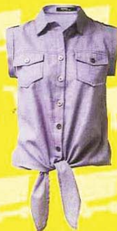
DANCING BETTY 丹宁上衣, RM79.90