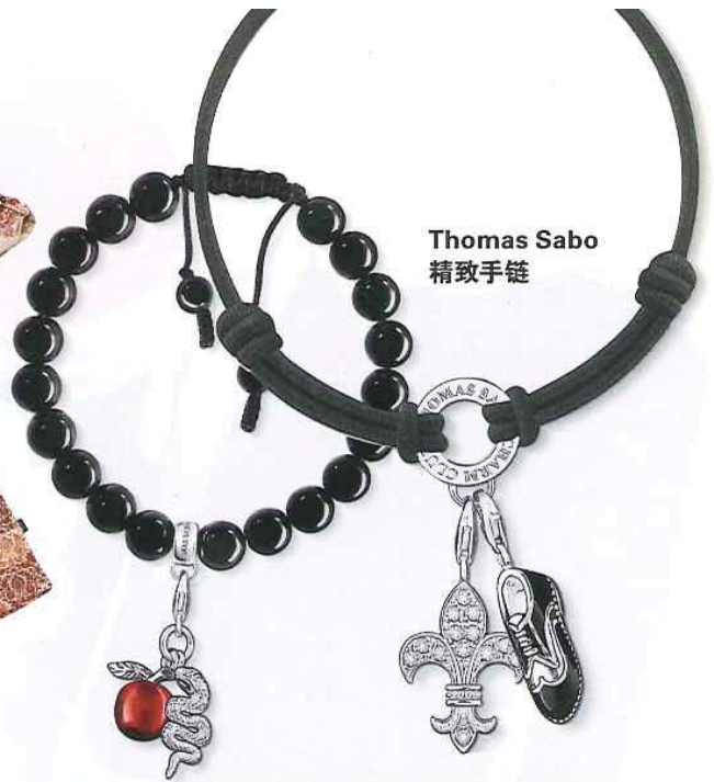
Thomas Sabo 精致手链