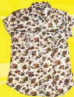
JEEP 碎花上衣, RM119