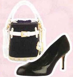
CARLO RINO 手提包，RM459 CHARLES & KEITH 亮面短跟鞋，RM129.90