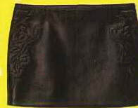
H&M 皮革短裙， RM399