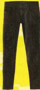
H&M 合身长裤， RM249