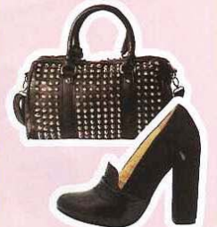
PULL & BEAR 铆钉包， RM199.90 AMORI 粗型高跟鞋， RM199.90

top: FBLOCK, RM43; skirt: DRESSING PAULA, 售价待定; bangle: BRANDS OUTLET, RM19.90