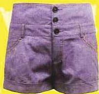
DANCING BETTY 高腰短裤, RM66.90