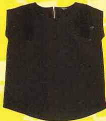
BIEM 黑色无袖上衣， RM99