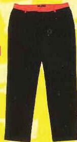
BIEM 黑色8分裤， RM129