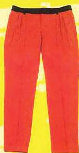
BIEM 宽松7分裤, RM129