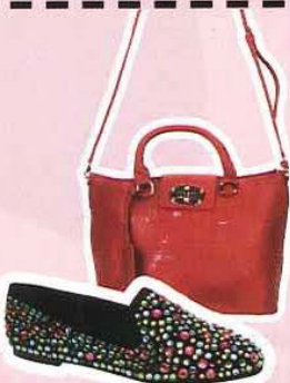
www.zalora.com.my, 红色肩包, RM109.90 STEVE MADDEN 闪石平底鞋, RM 480