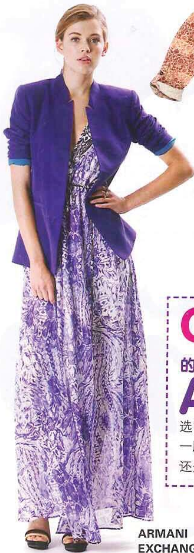
ARMANI EXCHANGE SS13