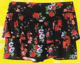
PULL & BEAR 碎花短裙, RM139.90