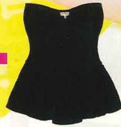
BERSHKA 黑色马甲, RM 139.90