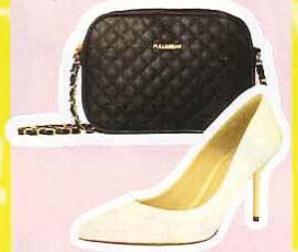
PULL & BEAR 菱角方形包， RM129.90; CHARLES & KEITH 蕾丝短跟鞋，RM139.90