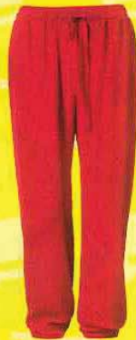
H&M 宽松长裤, RM 139