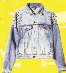
PULL & BEAR 铆钉丹宁夹克, RM259

vest: H&M, RM99.90; shirt: BRANDS OUTLET, RM49.90; top: BRANDS OUTLET, RM19.90; pants: DEEP BOUTIQUE@I-SQUARE, RM45; shoes: AGAPE BOUTIQUE @I-SQUARE, RM89.90