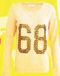
ESPRIT 数字长袖衣, RM249.90